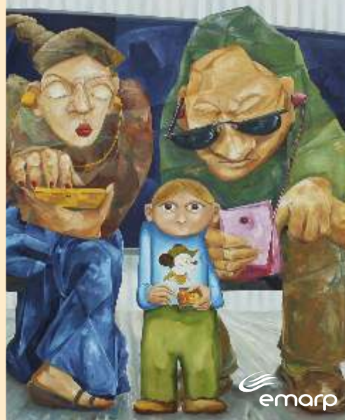
Atendimento da EMARP